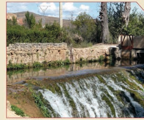
// La Paradera del río Mesa (Ibdes)

GR 24 to Cimballa leaves Llumes from the road crossing on the footpath that, after crossing a pontarrón, runs over the protective wall of the Piedra River in the direction of the quarter of Casas de la Vega. It goes out to the trail that crosses the village and follows it to the left. Before leaving the village it crosses the river, to the left, on a footbridge and takes a riverside trail to the crossing of the fishermen's shelter. There it continues on the right, crosses the Piedra again and an irrigation ditch and ends in a road over a small hill. GR 24 continues to the left about two hundred metres on the asphalt until it again takes the dirt surface of a road to the right that climbs up a small hill and, on the other side, descends to the trail that borders the fertile plain of the Piedra River. On this new trail it goes to the right under the slope of the mount that borders on the fertile plain and that ends in Cimballa, after passing through the turnout of the observation point, the mill and the natural place of Los Ojos.