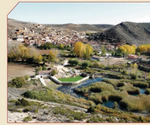
// Los "Ojos" y Cimballa al fondo.

Marcas de seguimiento del sendero de Gran Recorrido